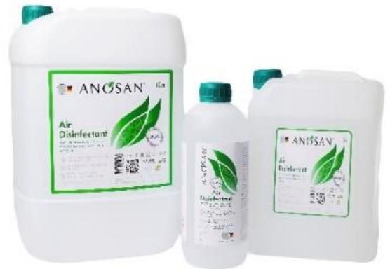
ANOSAN® для воздуха