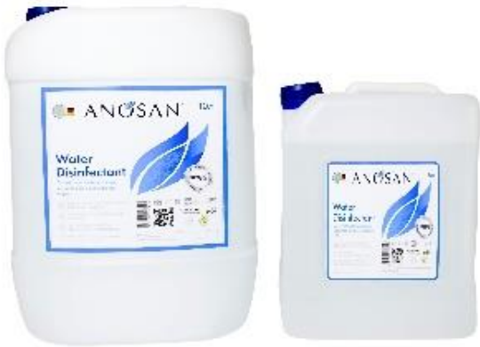
ANOSAN® для воды