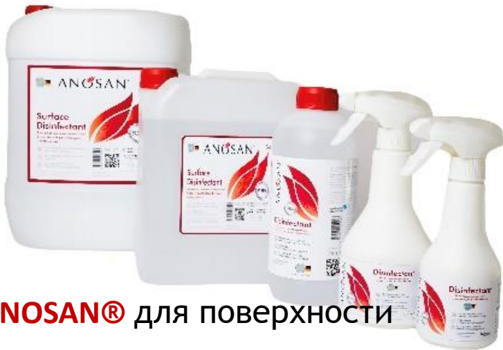
ANOSAN® для поверхности